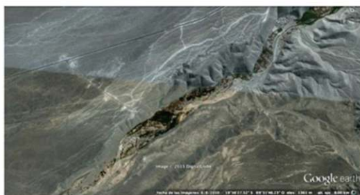
Fichas de Análisis de Casos Tipológicos por Asentamiento