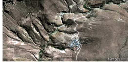
Asentamiento de Usmagama. Google Earth. Arq. Patricio Julio E.