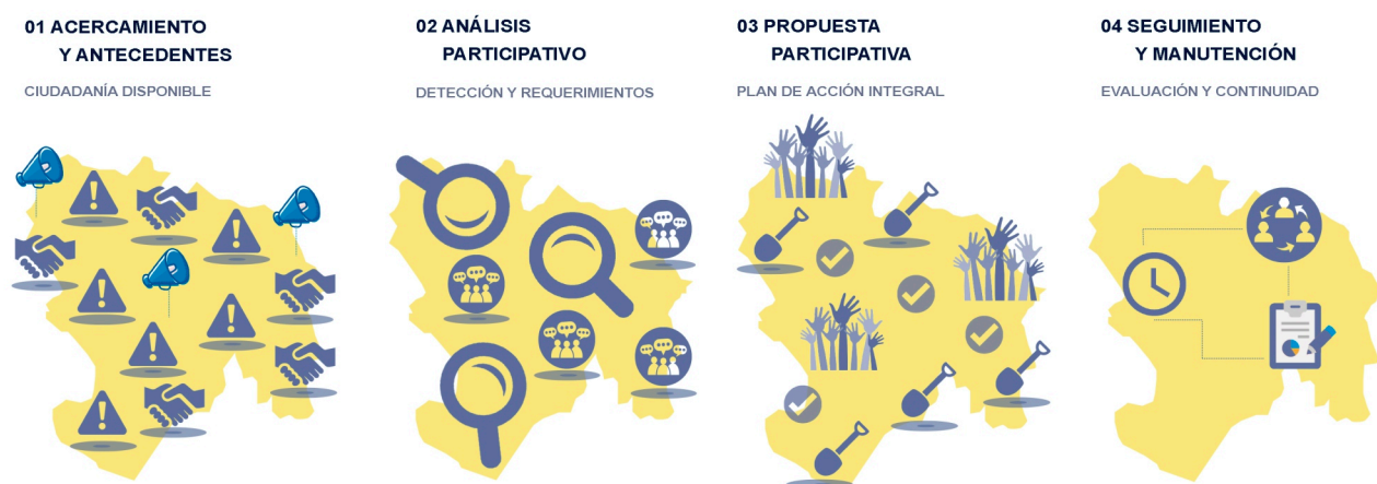
Figura 4. Etapas de un proyecto participativo de FuturoPiura.