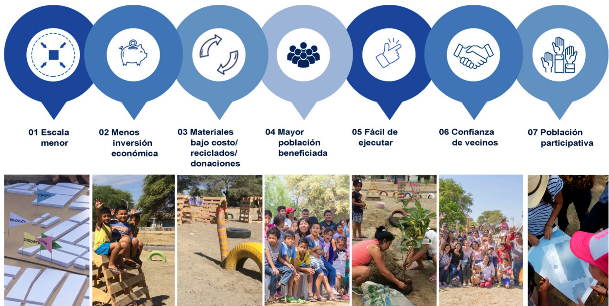
Figura 3. Reglas o criterios para una intervención participativa de FuturoPiura.