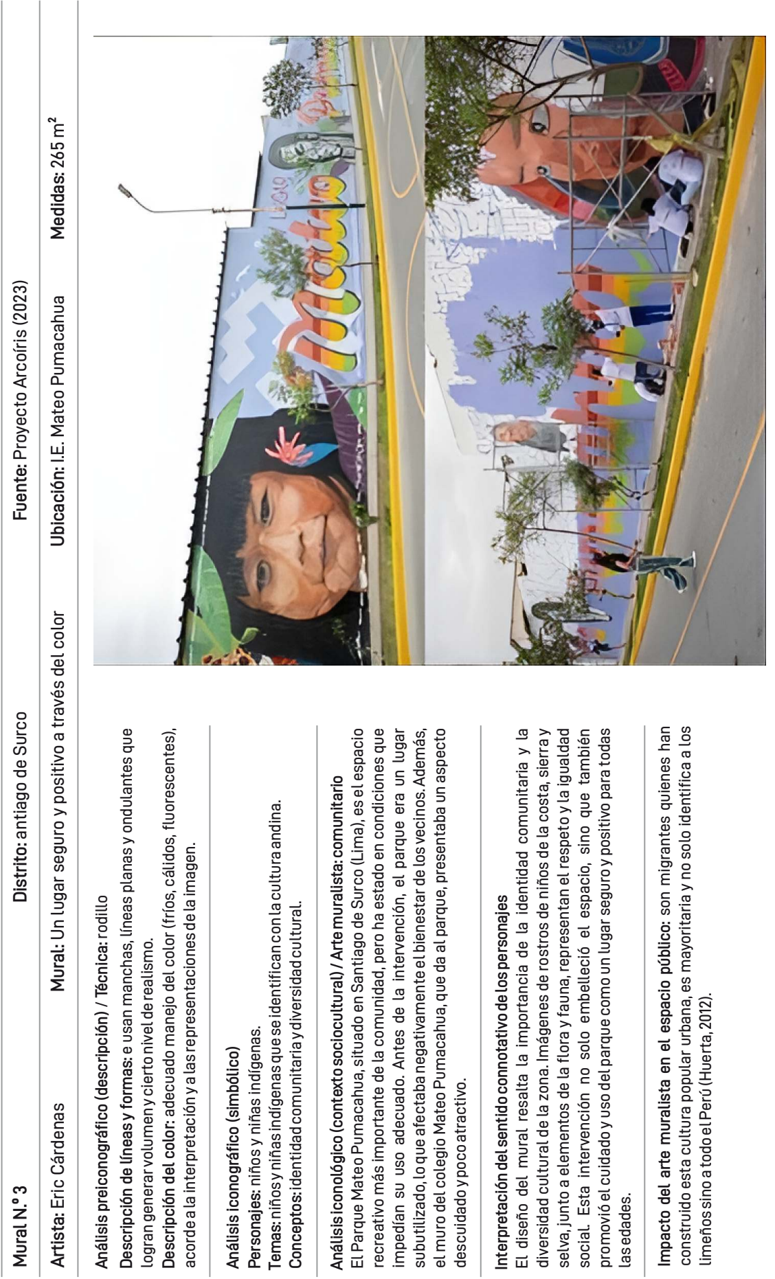
Tabla 3 Análisis fotográfico del mural 3

Nota. Elaboración propia. https://proyecto-arcoiris.com/intervenciones/proyectos-2023-peru/i-e-mateo-pumacahua-santiago-de-surco-lima/